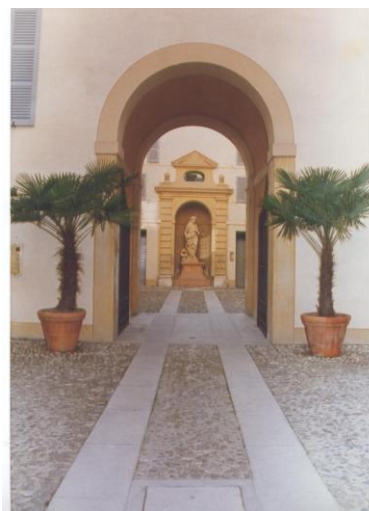
Palazzo Montecuccoli sede dello studio